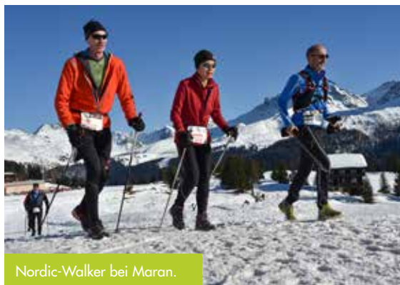
Nordic-Walker bei Maran.

Ab dem 21. November 2022 ist die Online-Anmeldung geöffnet unter www.snowwalkrun.ch .