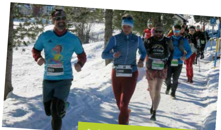
Rund um den Obersee.

Detaillierte Hotelinformationen finden Sie auf unserer Website unter «Service».