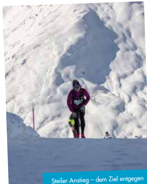
Steiler Anstieg – dem Ziel entgegen