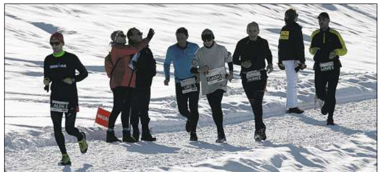
Läufer im Gleichschritt.