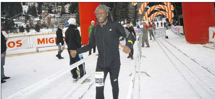
Glücklich und zufrieden ist dieser Läufer im Ziel.