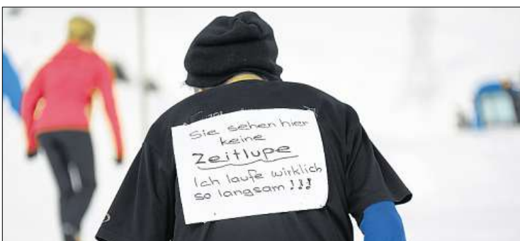
Die Zeit spielt diesem Walker keine Rolle.