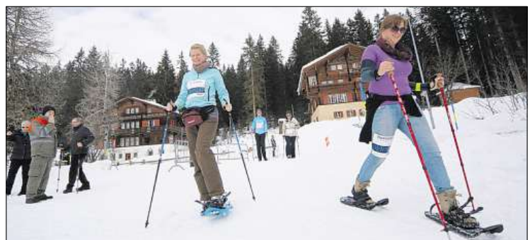
Die Schneeschuhläuferinnen scheinen den Swiss Snow Walk & Run zu geniessen.